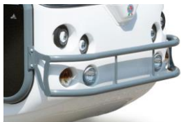
Optionen Bullbar für vorne

Sitzbank für 3 Passagiere, mit Sicherheitsgurt