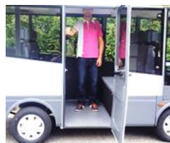
Stehplatz mit Haltestange