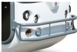
Optionen Bullbar für vorne